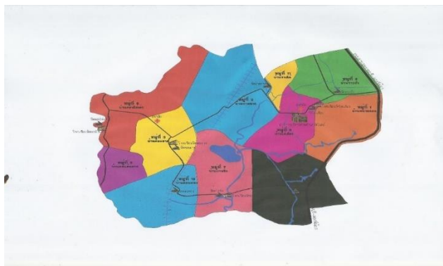
ภาพที่ ๑ แผนที่ตำบลวัดโบสถ์