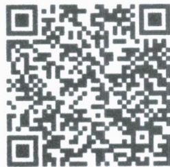
ดาวน์โหลดใบสมัครและเอกสารโครงการ