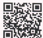
QR-Code เพื่อจองห้องพัก

โทรศัพท์: ๐๒-๔๒๒-๙๒๒๒ E-mail : rsvn@royalriverhotel.com